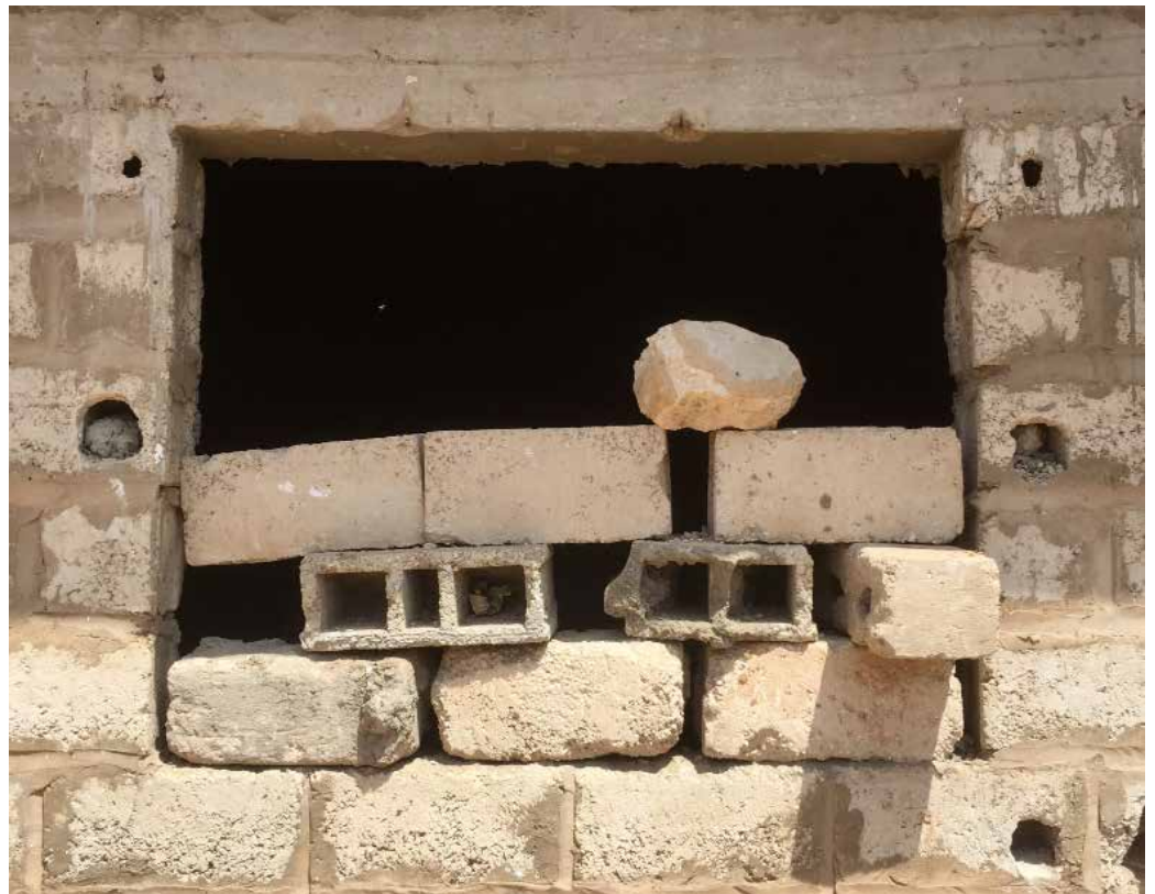
Sénégal, 2017 © Rodolphe Huguet

En partenariat avec la tuilerie Monier et le Frac Franche-Comté.