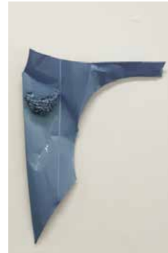
Nid d'aile , 2009, aile de voiture cabossée, nid d'hirondelle, résine pulvérisée, peinture carrosserie métallisée vernie.