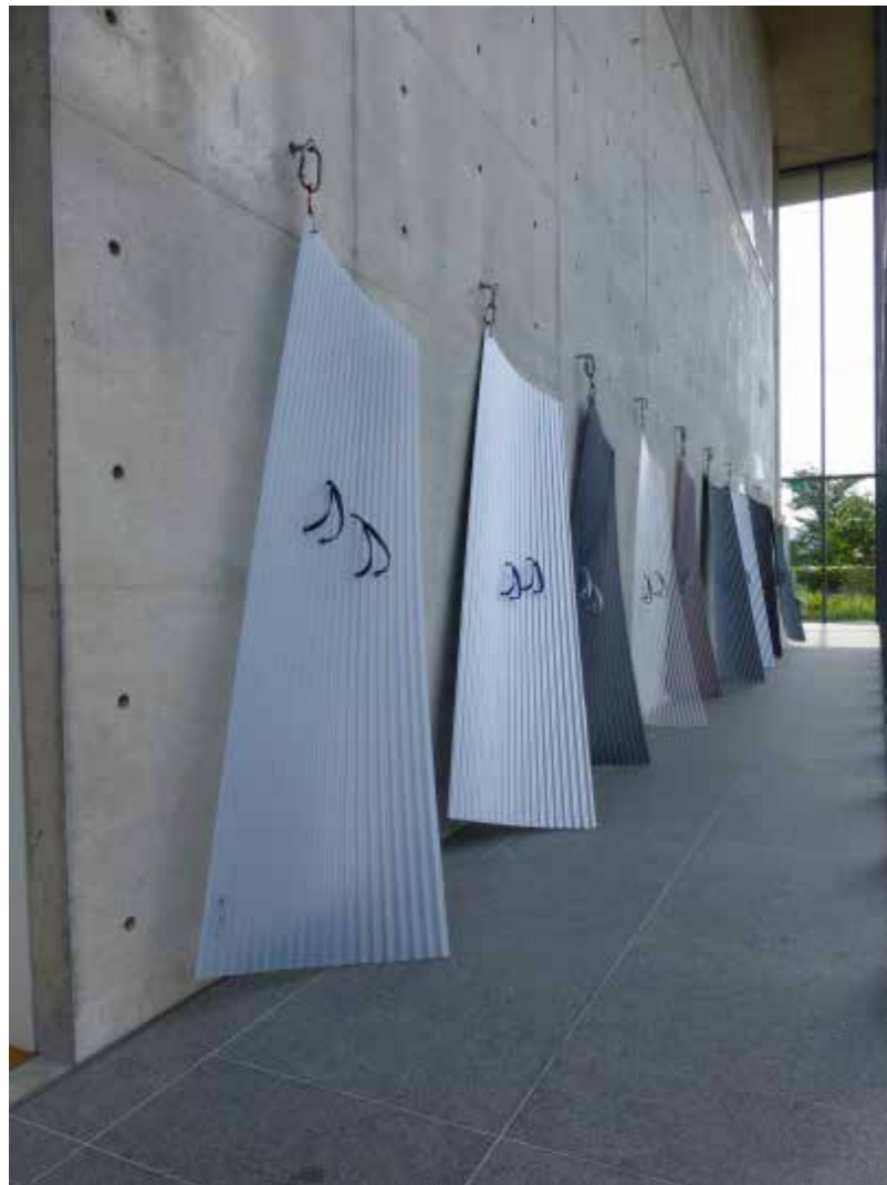
Surf people , 2013, tôles ondulées en pvc de couleurs, lanières de tongs, mousquetons et attaches de bateau, 12 x 2,4 m, exposition «La mer secrète», Onomichi city museum of art, Japon.

Hiroshima Art Document , Hiroshima, Japon.