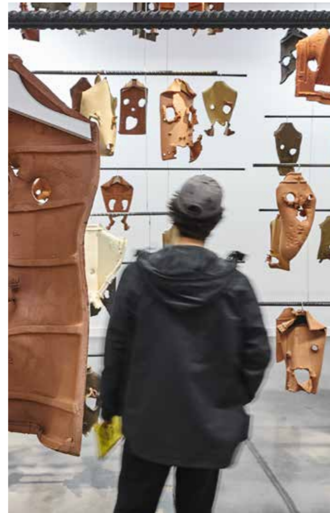
Rodolphe Huguet, Sans titre (Épisode Méditerranéen) , 2017/2018 174 tuiles en terre cuite brute et engobées, cintres, fer à béton.