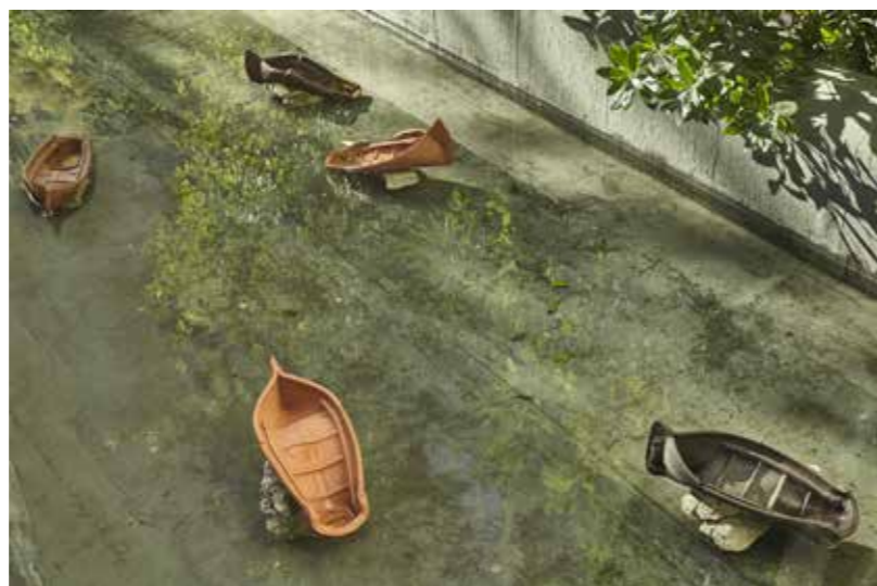
Rodolphe Huguet, Bon Vent , 2018 32 barques en tuiles pliées, terre cuite brute engobée, cailloux, parpaings, fragments de blockhaus.