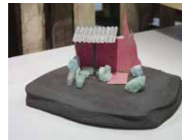
Maison de Mineur , 2012-2013, terre cuite, briques lapidées en quartz rose et onyx, bloc d'améthyste violette brute, tôle ondulée en argent, bois, contre plaqué, 34 x 33 x 13,5 cm.

Pièges à sieste , Le Vent des Forêts, Fresnes-au-Mont.