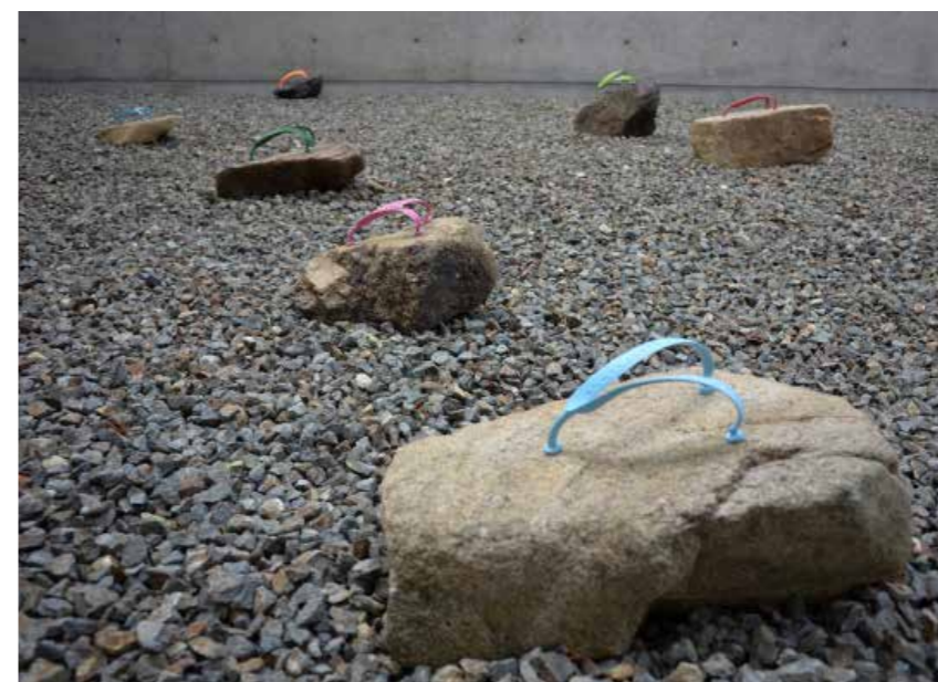
Armada 1 , 2013, 20 pierres de rivière, lanières de tong, dimensions variables, exposition «La mer secrète», Onomichi city museum of art, Japon.

FIAC, Galerie Martine et Thibault de la Châtre, Paris.