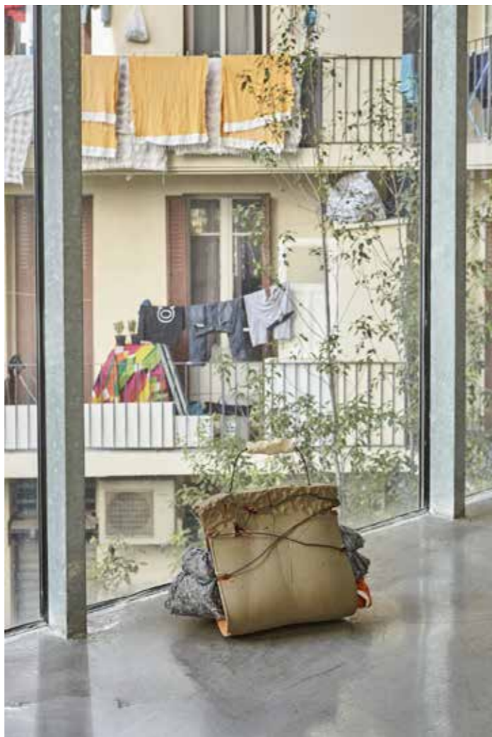
Rodolphe Huguet, Pièges à rêves , 2018 Poignées de mains en terre cuite, fil de fer recuit.