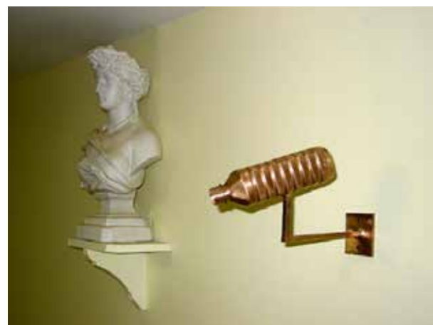
Exposition Villagesousurveillance 2 , 2005-2006, 20 caméras en bronze Installation de caméras dans les mairies de 13 villages, haute saône, France.

Sur le Fil (2) , Musée international d'art modeste, MIAM, Sète. (catalogue).